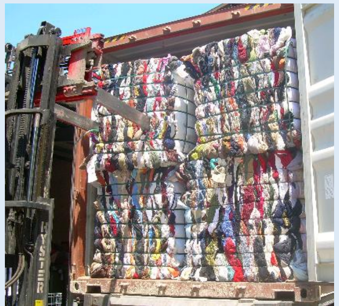
Càrrega d'un camió amb roba reciclable, destinat a l'exportació

Creiem que aquesta transparència animarà als usuaris dels contenidors a participar amb Roba Amiga en aquest procés de transformació d'un residu en un recurs, que tant suport dona al treball social a les nostres comarques.