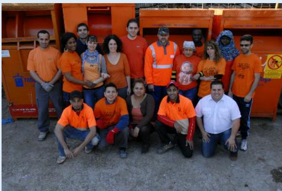
Grup de treballadors d'una de les plantes de triatge de Roba Amiga a Catalunya

Roba Amiga i totes les entitats i empreses que formen part de la xarxa per l'aprofitament d'aquest residu estem profundament agraïts per la vostra col·laboració.